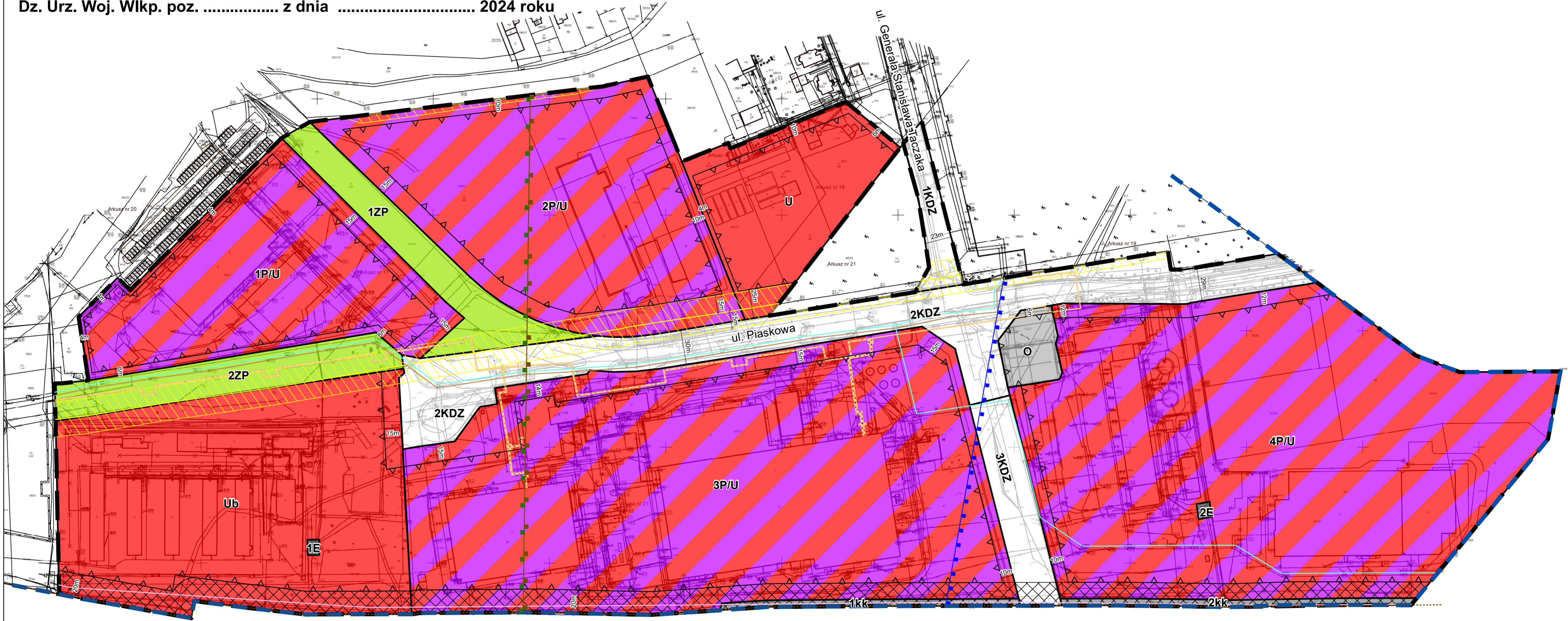
Studium uwarunkowań i kierunków zagospodarowania przestrzennego gminy Czerwonak Skala 1: 10 000

Załącznik nr 1 do uchwały Nr ..... Rady Gminy Czerwonak z dnia ..... 2024 r. Dz. Urz. Woj. Wlkp. poz. .... z dnia ..... 2024 roku