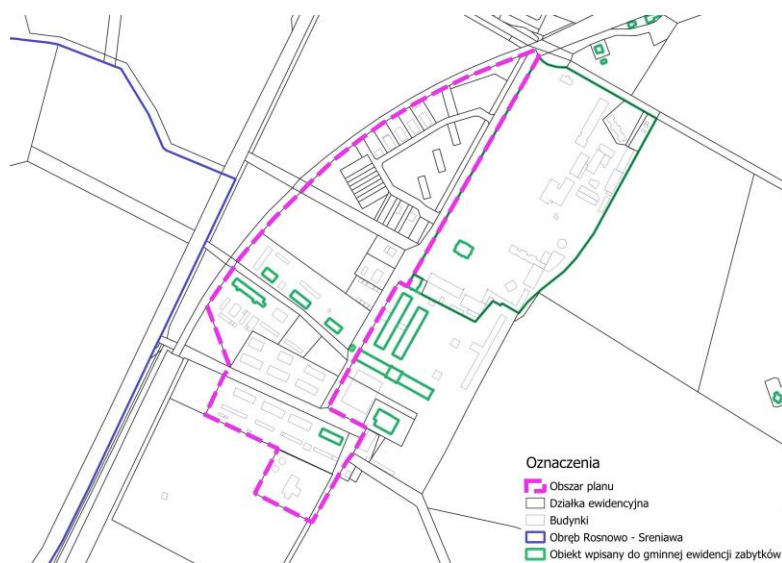
Ryc. 3 Lokalizacja obiektów wpisanych do gminnej ewidencji zabytków