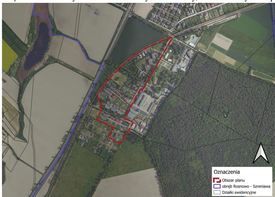
Ryc. 1. Teren objęty projektem planu na tle ortofotomapy

Analizowany teren od północnego – zachodu graniczy z terenem kolejowym – linią kolejową nr 357 relacji Powodowa – Luboń k. Poznania, odcinek Wolsztyn – Luboń k. Poznania. Teren po wschodniej stronie, po przeciwnej stronie ulicy Dworcowej graniczy z terenem Muzeum Narodowego Rolnictwa i Przemysłu Rolno - Spożywczego. Znajdują się tam głównie budynki zakwalifikowane jako biurowe, przemysłowe inne lub transportu i łączności oraz budynki zaliczane do budynków oświaty, nauki i kultury oraz sportu.