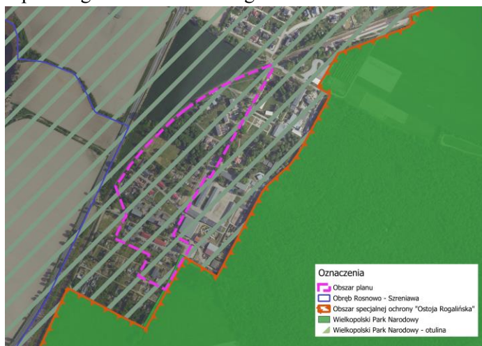
Ryc. 4. Obszar planu na tle ortofotomapy z danymi udostępnionym przez Generalnego Dyrektora Ochrony Środowiska,