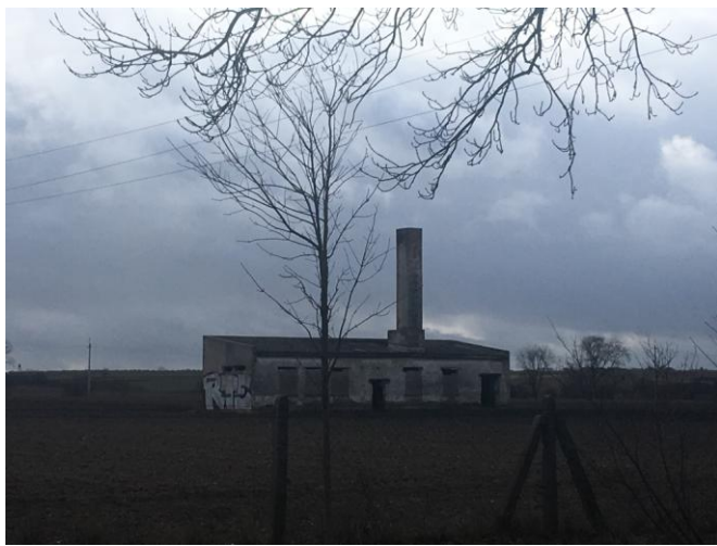
Zabudowania gospodarcze w obrębie planu