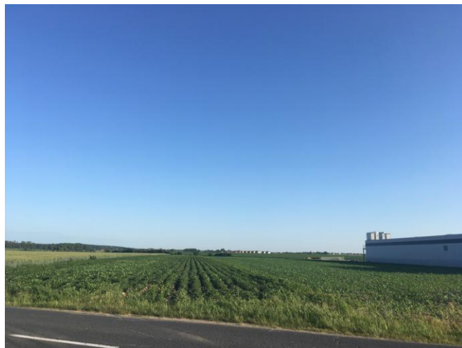
Część zachodnia terenu objętego opracowaniem