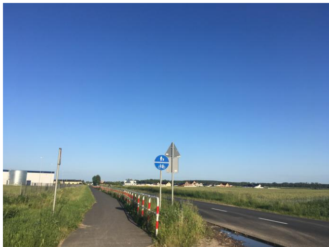
ul. Polna – droga powiatowa wzdłuż terenu opracowania