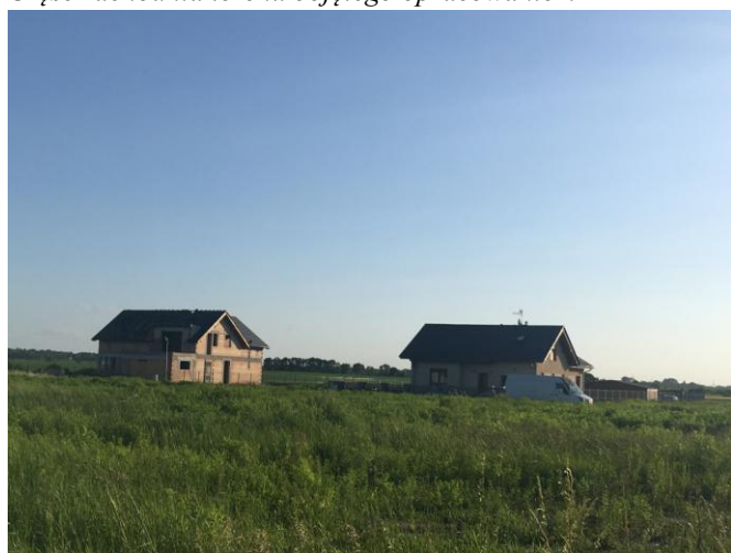
Tereny zabudowy mieszkaniowej zlokalizowanej w sąsiedztwie planu