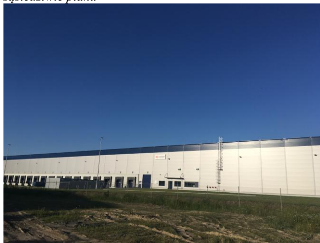
Wielkie hale logistyczne firmy Panattoni, położone w sąsiedztwie planu