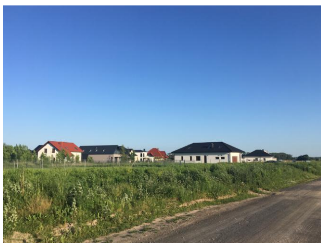
Tereny zabudowy mieszkaniowej zlokalizowanej w sąsiedztwie planu