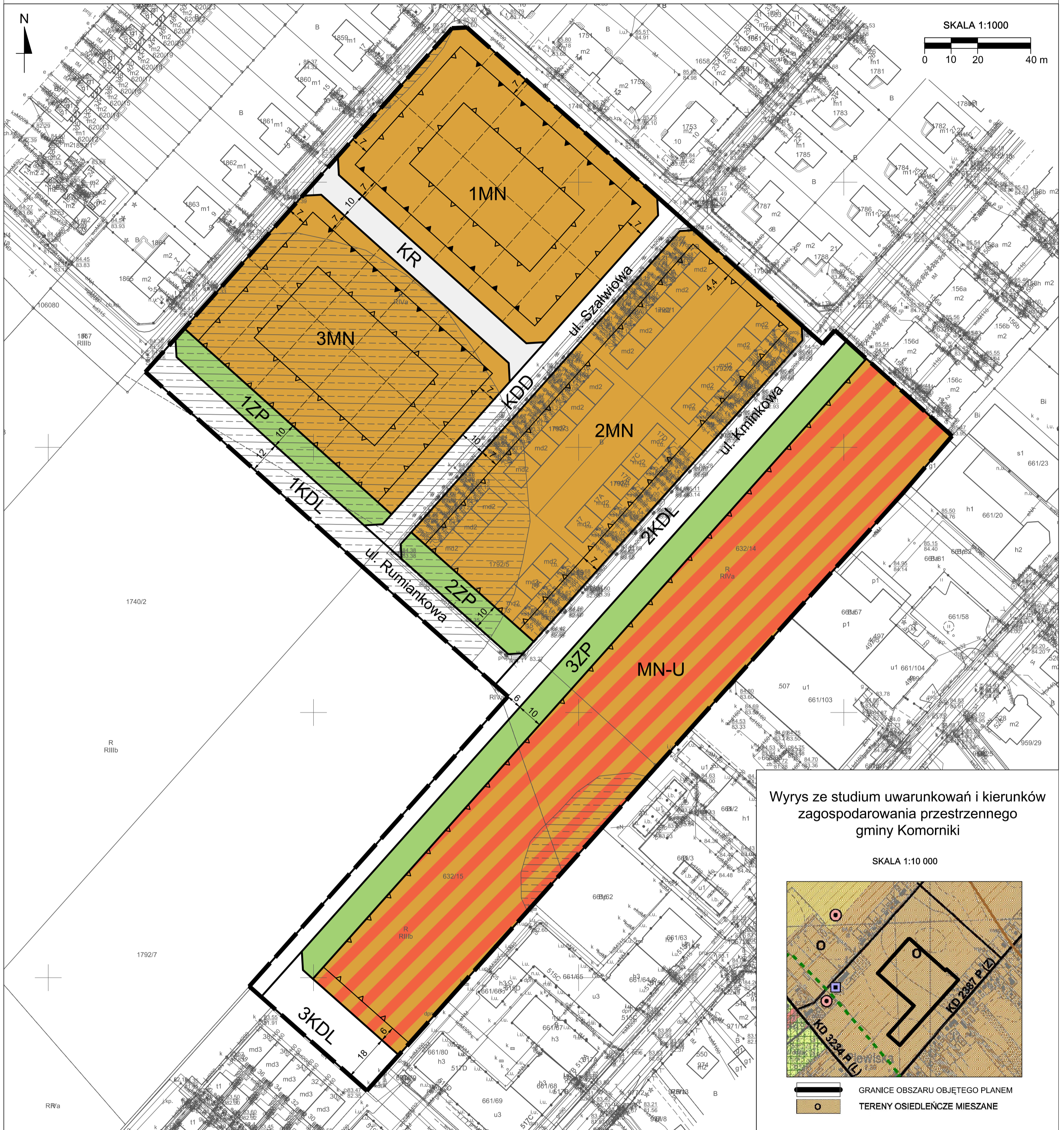
Wyrys ze studium uwarunkowań i kierunków zagospodarowania przestrzennego gminy Komorniki

ZAŁĄCZNIK NR 1 DO UCHWAŁY NR ..... RADY GMINY KOMORNIKI Z DNIA ..... R. OPUBL. DZ.U.WOJ.WLK.P. POZ. ... Z ... R.