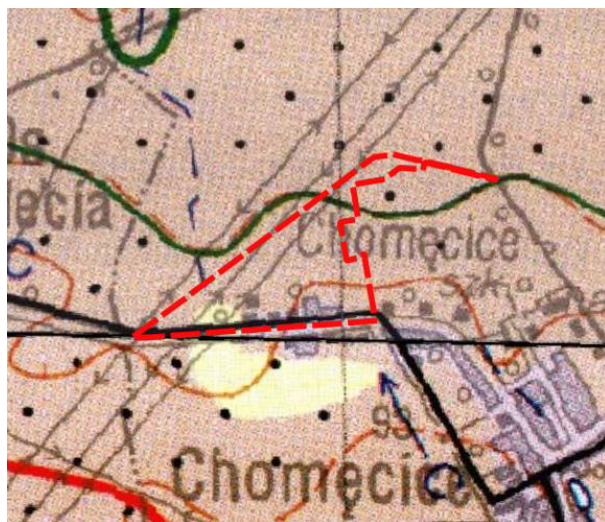
Ryc. 1. Obszar opracowania projektu planu na tle Mapy Hydrograficznej Polski

— granica obszaru objętego projektem planu