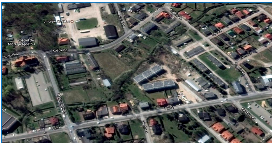
Obszar opracowania mpzp.

Z uzasadnienia do uchwały o przystąpieniu do opracowania miejscowego planu zagospodarowania przestrzennego wynika, że obszar ten nie jest objęty obowiązującym miejscowym planem zagospodarowania przestrzennego, a do przedmiotowego planu przystępuje się w celu uporządkowania istniejącej zabudowy oraz umożliwienia zabudowy terenów nie zainwestowanych.